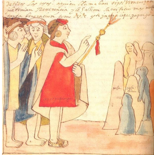
Martín de Murúa, Historia y genealogía de los reyes incas del Perú , Galvin manuscript (1590)

החוג ללימודים רומאניים ולטינו אמריקניים שמח להזמינכם להשקת הספר: